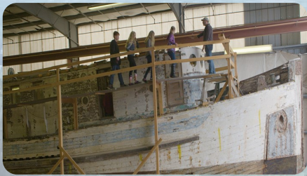
Los inicios de la restauración

En 2019, Berea College se convirtió en parte del viaje de restauración del histórico cerquero, el Western Flyer , construido en Tacoma, Washington, en 1937. John Steinbeck y Edward Ricketts completaron un viaje al Mar de Cortés, sobre el que Steinbeck escribió más tarde en The Log from the Sea of Cortez . Con el tiempo, el libro y la leyenda del Western Flyer se hicieron famosos entre aquellos que resonaban con los mensajes de aventura y libertad.