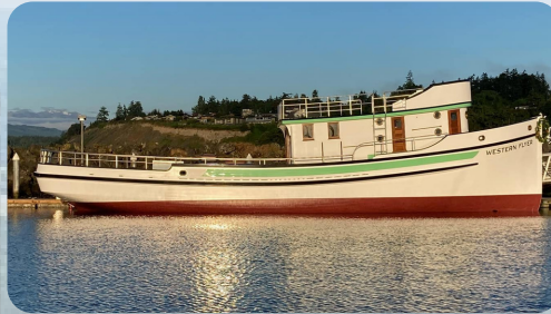
El Western Flyer después de su reciente lanzamiento

La Western Flyer Foundation adquirió y comenzó a trabajar para restaurar el buque en 2015. La reconstrucción del marco y la "caja torácica" del barco requirió que la madera de roble blanco se doblara al vapor, que el equipo obtuvo y encontró en el bosque de Berea College. Los robles blancos requieren suelos fértiles y muchos años para crecer a su máximo potencial. Las prácticas de manejo forestal en Berea permitieron que los árboles utilizados en este proyecto, así como en la construcción del Mayflower II , crecieran a la altura y anchura necesarias para proyectos como estos. La eliminación de árboles cuando alcanzan su punto máximo permite que los individuos a su alrededor crezcan fuertes y saludables. Los troncos para el Flyer fueron extraídos por la tala de caballos, creando una perturbación mínima para el medio ambiente. Fueron fresados en un aserradero en Kentucky y enviados a Port Townsend, Washington. Por fin, el 30 de junio de 2022, el restaurado (cont. en la página 2)